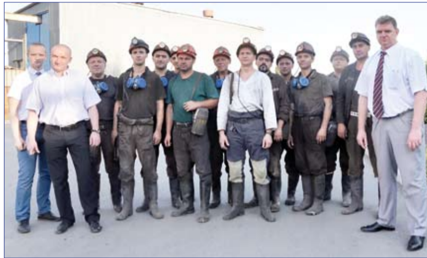
Коллектив участка МДО-1 занимается монтажом 12 южной «бис» лавы блока №10.

Без качественно и своевременно сделанной работы горномонтажниками справиться с заданиями по угледобыче было бы сложно. Они готовят к монтажу не просто лавы, а магистральные участки, в которых прокладываются километры ленточных конвейеров, электрические сети. В новых лавах монтируются механизированные комплексы – ЗКД 90Т, ДМ, комбайны – JOY, MB, лавные конвейеры SZK, ленточные – 2ЛТ100 и 2ЛТ120, подлавные – PZF и другая техника.