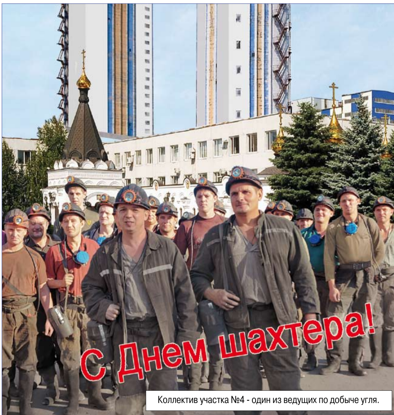
Коллектив участка №4 - один из ведущих по добыче угля.

Считанные дни отделяют нас от главного в нашем крае праздника – Дня шахтера. Этот год для угольщиков особо знаменателен: Дню шахтера исполняется 70 лет. В преддверии праздника шахтерские коллективы традиционно подводят итоги работы, отмечают основные достижения.