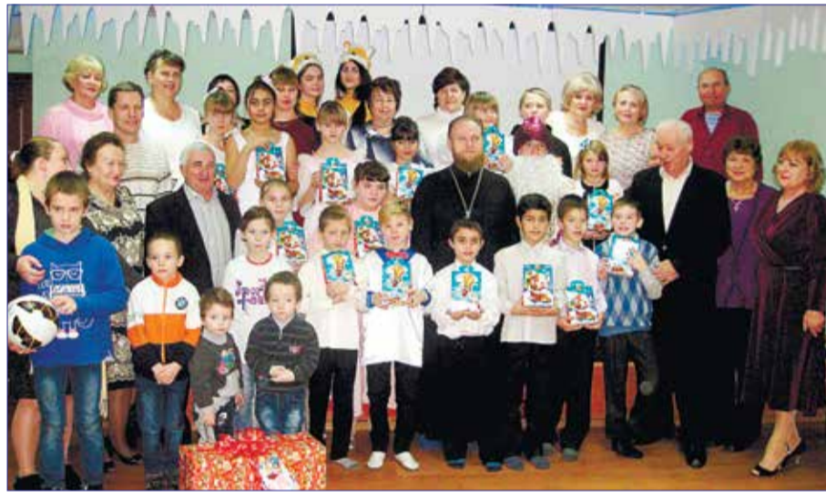
Воспитанники центра помощи детям «Отчий дом» с участниками клуба «Золотой возраст» и пенсионерами шахтоуправления.

Они стали родными людьми, а для некоторых - и самыми близкими. Добрая и волшебная история под названием «Невиданными чудесами известен святой Николай по всей земле» объединила и взрослых, и детей, в которой было место и песням, и танцам, а также сладким угощениям и подаркам.