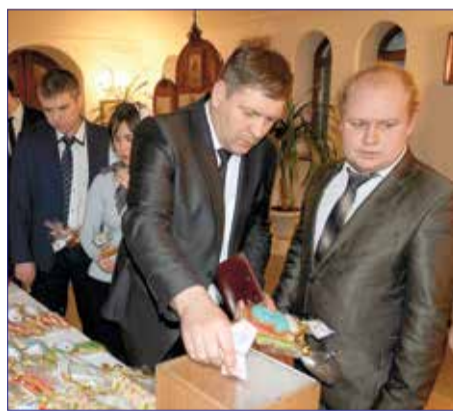
Входе благотворительной ярмарки в Свято-Покрово-Никольском храме каждый работник мог приобрести вкусные и красивые подарочные наборы пряников.