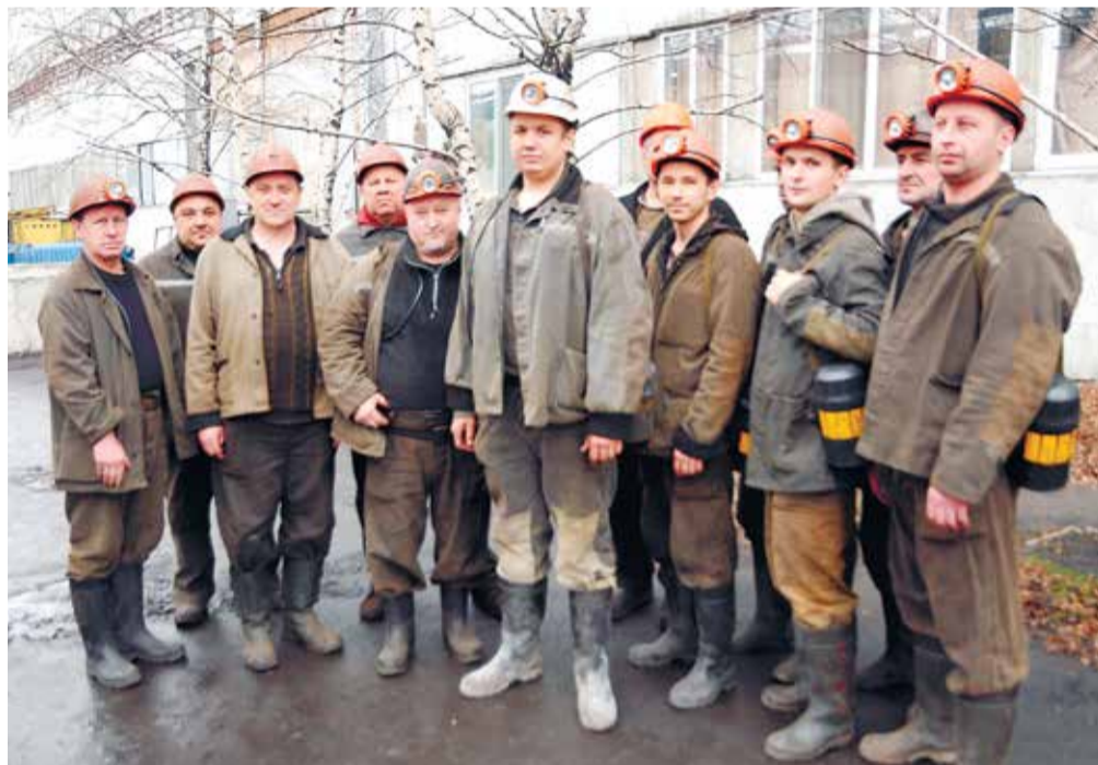
Коллектив участка РТВУ – один из ведущих в энерго-механической службе.

На создание безопасной рабочей среды, повышение уровня знаний и формирование потребности работать безопасно направлена работа Центра профессионального обучения, который в этом году отметил свое десятилетие. За эти годы здесь прошли обучение более 45 тысяч работников шахтоуправления и подрядных организаций. Сегодня Центр ведет подготовку специалистов по 67 профессиям и выполняет все функции учебно-курсового комбината.