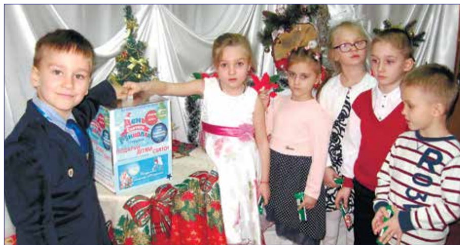
Одни из самых активных участников благотворительной акции - воспитанники ДООУ «Золотая рыбка».